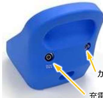
カフチューブ接続口 充電アダプター接続口